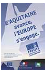
Plaquette bilan 2000-2006 (16p)

http://www.aquitaine.pref.gouv.fr/politiques/progeurope/plaquette_16p.pdf